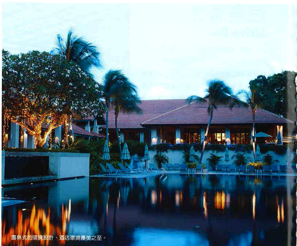
園林式的環境設計，酒店環境優美之至。