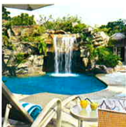
極受女性歡迎的泥漿浴，做完皮膚靚靚。