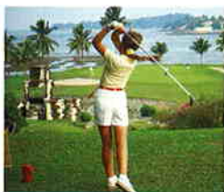
酒店旁邊是大型高爾夫球場，正可閒來鬆一鬆。

新增了一個全新加坡最大型的Spa及大獲好評的格調餐廳The Cliff後，更叫人刮目相看。