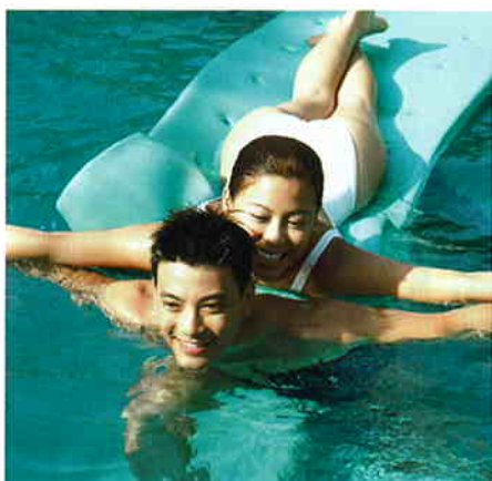
情侶一起到來享受Spa設施，溫馨甜蜜。

Spa內亦特設有男士美容及按摩療程，情侶大可拍拖到來齊齊放鬆一番。除各式各樣的按摩、浸浴、美容等服務之外，還有泥漿浴池、浮力泳池、大水桶浴池及水力極猛的小型瀑布等，總之玩法多多，必定能滿足不甘平凡的你。