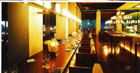
獲獎無數的The Cliff，環境簡潔雅致。