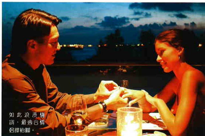
如此浪漫情調，最適合情侶擇約。